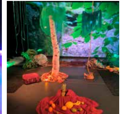
Bilder om havet, skogen, trädgården.

Teatrar som undervisningsmiljöer är ett innovativt, tvärdisciplinärt forskningsprojekt som sammanför universitetsstudenter, grundskole- och förskolelärare samt teatrar för att skapa immersiva, multisensoriska och transdisciplinära undervisningsupplevelser. Det är en sympoiesis där dramapedagogik, visuella element, scenografi, ljus, ljud, berättelser, material och människor samspelar för att skapa en helhetsupplevelse inom dramapedagogiken.