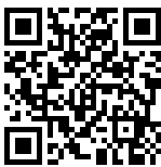
Kort promotional film